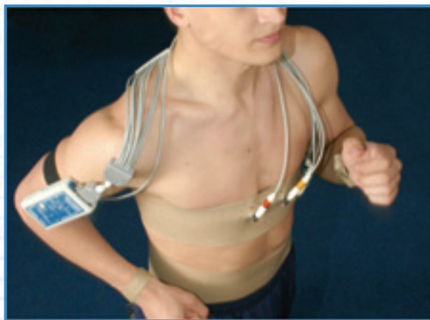
Проведение нагрузочного тестирования на тредмилле с использованием многоразовых ЭКГ-электродов, закрепленных резиновыми лентами