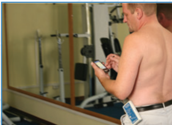
Проведение обследования с отображением ЭКГ на наладонном компьютере