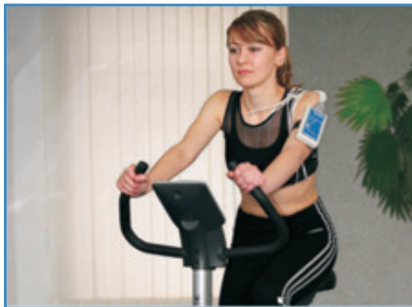
Проведение нагрузочного тестирования на велоэргометре с использованием одноразовых ЭКГ-электродов

видимости — не менее 7 метров. Для регистрации можно применять как одноразовые, так и многоразовые электроды, зафиксированные резиновыми лентами. А набор специально разработанных цифровых фильтров позволит устранить даже очень сильные помехи.